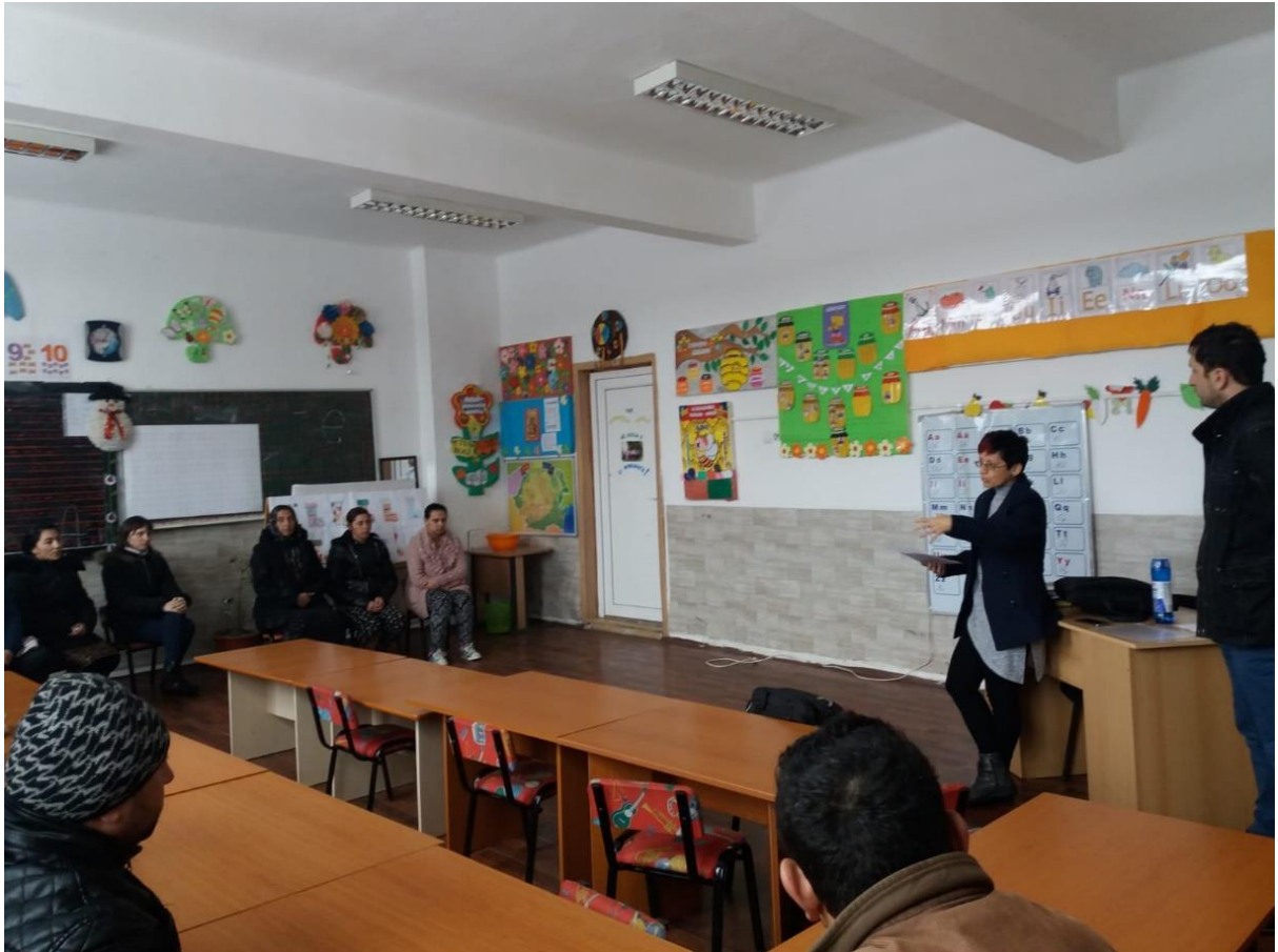
Întâlniri cu profesori: